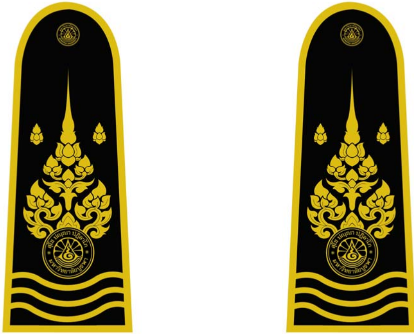
รูปที่ ๔. อินทระฆ