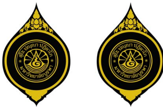
รูปที่ ๒. เข็มตราสัญลักษณ์มหาวิทยาลัย