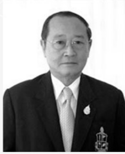
ดร.สุเมธ ตันติเวชกุล กรรมการสภามหาวิทยาลัยผู้ทรงคุณวุฒิ